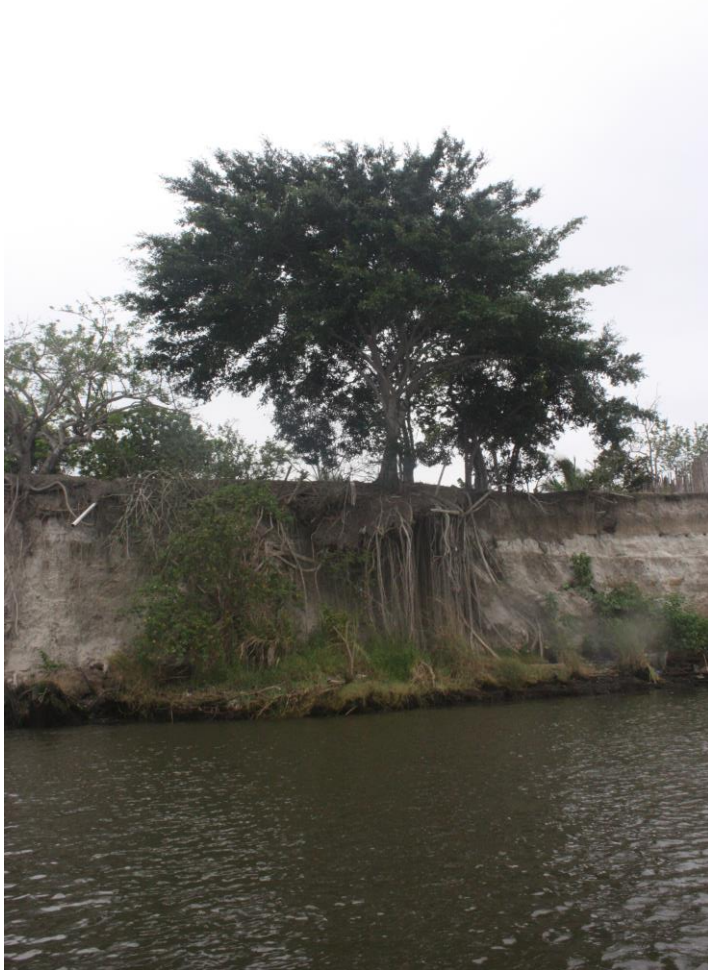
Esmeraldas river, Ecuador 2020

The definitions of the terms restoration and rehabilitation vary considerably and oftentimes they are used interchangeably. Rehabilitation involves the repair, not the recreation, of a disturbed or damaged ecosystem. The process encompasses 2 major components: treatment of the factors leading to degradation and replacement of ecosystem components that have been lost (individual species or communities). To succeed rehabilitation must create a self maintaining biotic assemblage that meets the expected end use for the site.