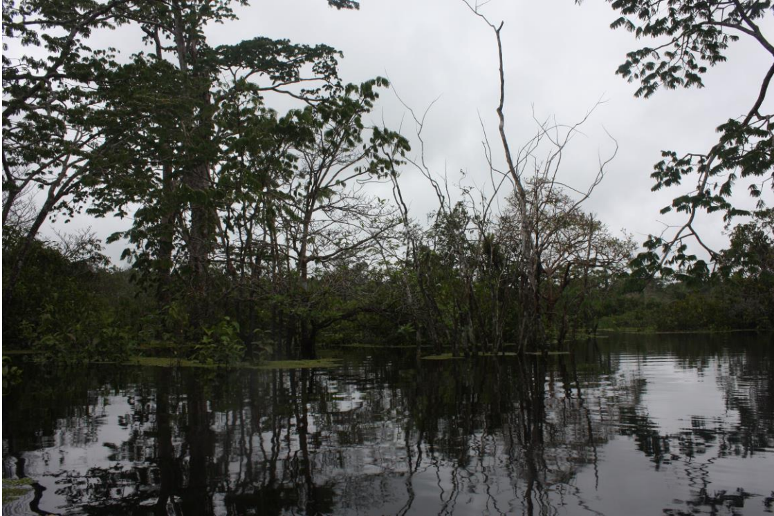
Cuyabeno river, Ecuador 2017

Rivers and freshwater lakes contain aprox. 0.009% of earth's water. Climate, geomorphology, regional chemistry and land cover determine fluvial diversity best known for fishes (8400 spp., 40% of the worlds total) and hygrophilous plant species (around 1000 spp., 0,3% of the worlds total). Riparian ecosystems are amongst the most productive ecosystems and are therefore a "magnet" for human settlements.