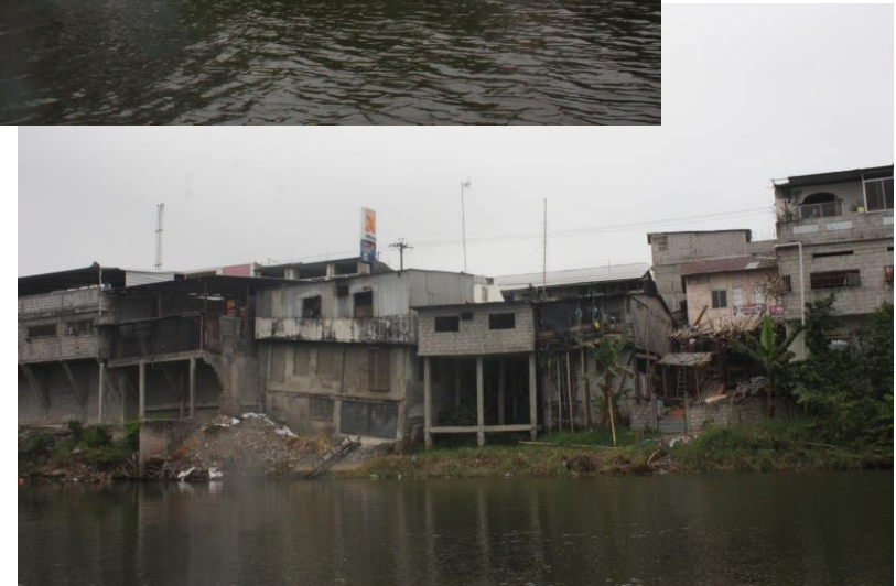
Esmeraldas river, Ecuador 2020