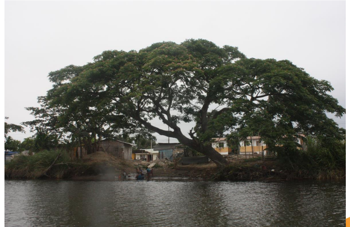
Esmeraldas river, Ecuador 2020