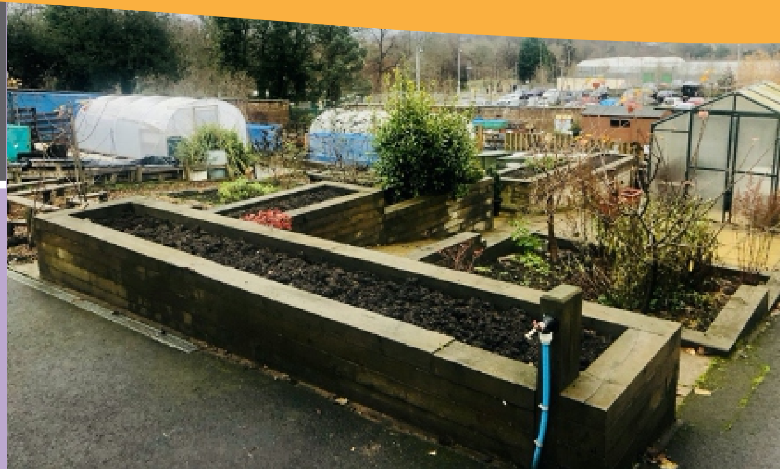
(Iznad) Bellahouston Demonstration Garden (demonstrativna bašta)

pitanjima učenja. Na ovaj način refleksivni monitor koristi agendu dinamičkog učenja kako bi održao pregled svih aktivnosti u koje su uključene njegove/njene kolege. Mapiranje ovih aktivnosti i njihovo provođenje u kritične prekretnice i pitanja učenja stvara mentalni prostor i vrijeme za refleksivnog monitora da o njima razmisli i preispita ih.