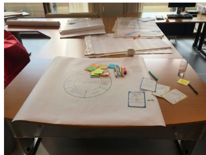
Eksperimentisanje sa novim formatima radionica

Implementacija rješenja zasnovanih na prirodi može biti složena zbog suprotstavljenih prioriteta i izazova. Prije nego što počnete primjenjivati refleksivno praćenje, korisno je imati iskustvo s prirodnim rješenjima i koprodukcijskim procesima. Ovo će vam pomoći da napravite razliku između onoga što je zaista inovativno i onoga što je 'business as usual' (posao kao i obično). Ovladavanje refleksivnim praćenjem zahtijeva stav eksperimentisanja. U početku bi proces mogao biti prilično neuredan jer ćete eksperimentisati s različitim koracima i alatima. Uskoro, refleksivno praćenje će Vam omogućiti da organizujete tekuće procese i da ono što naučite pretočite u djela. Gradovi Genk (Belgija), Glasgow (Škotska) i Poznań (Poljska) su otkrili da je mudro rezervisati prostor i vrijeme kako bi se upoznali sa koracima i alatima prije nego što nastave s njima. Kada se proces refleksivnog praćenja uskladi sa Vašim svakodnevnim aktivnostima, moći ćete identifikovati prednosti i djelovati na osnovu onoga što naučite.