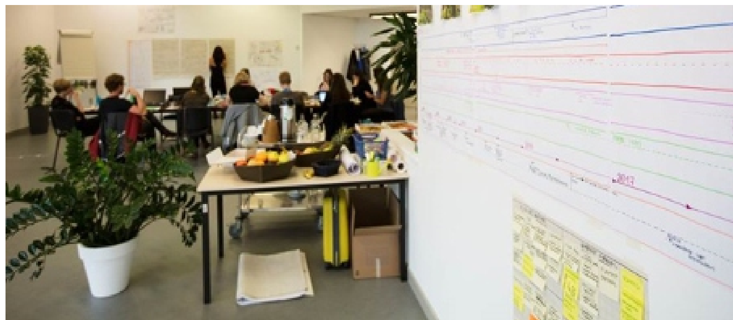
Radionica refleksivnog praćenja u Genku.