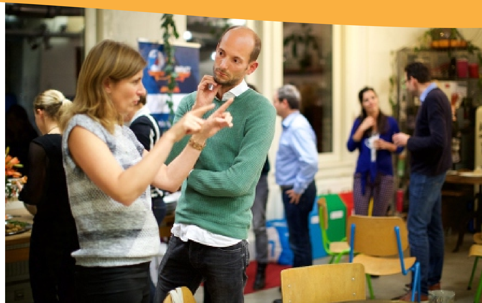
Urbani praktičari raspravlja o efikasnosti refleksivnog praćenja.

Detaljna analiza ishoda učenja pomaže timu da bolje razumije i objasni drugima šta su naučili i na koji način je njihov rad inovativan.